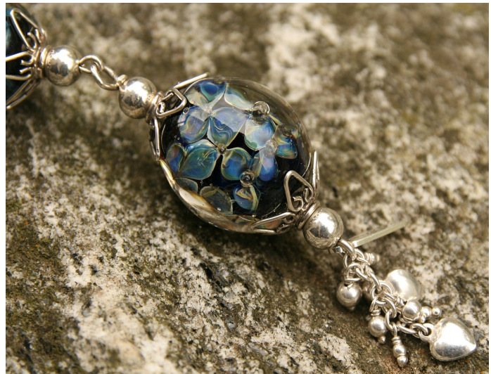
Fimokurse Perlen aus Knetmasse formen die Farben selber zusammenstellen