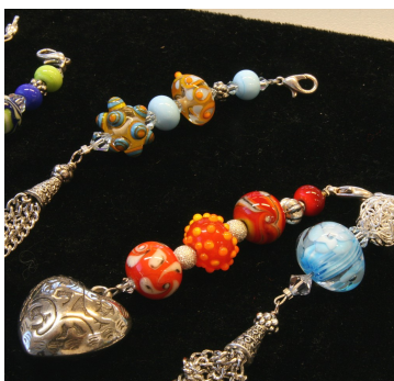
Anhänger Glasperlen 2011