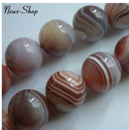
Individuelle Ketten aus Mineralien zusammenstellen

Hier in Winterthur finden Sie Schmuckkurse beachten Sie auch unser Frühjahrsprogramm ab Januar Schmuckkurse