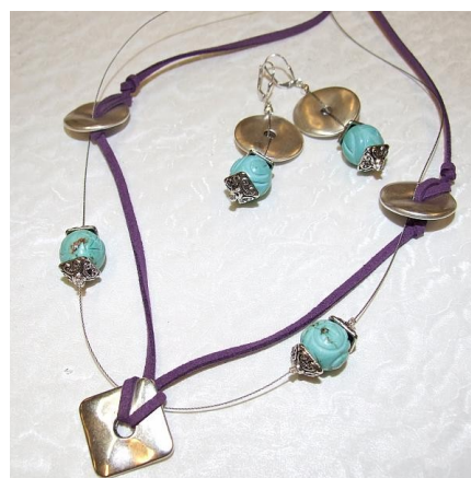
Modeschmuck selber Designen herstellen