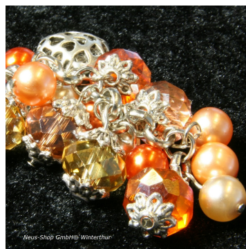
Tropfenanhänger Bastelset von Neus Shop Link zum Montagevideo